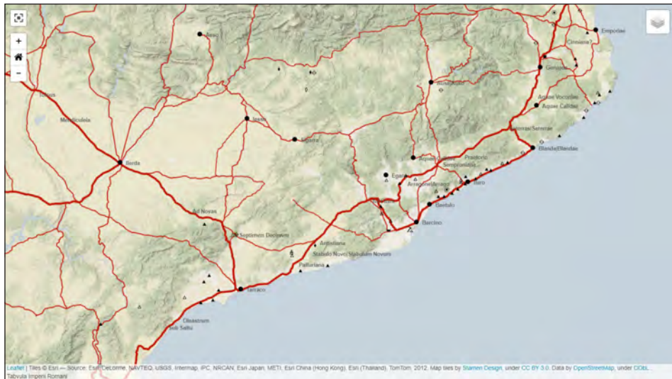
FIGURA 4. Les principals terrisseries de l'àrea catalana que produïen àmfors vinàries. Mapa generat per l'autora a partir de l'aplicació TIR-FOR.